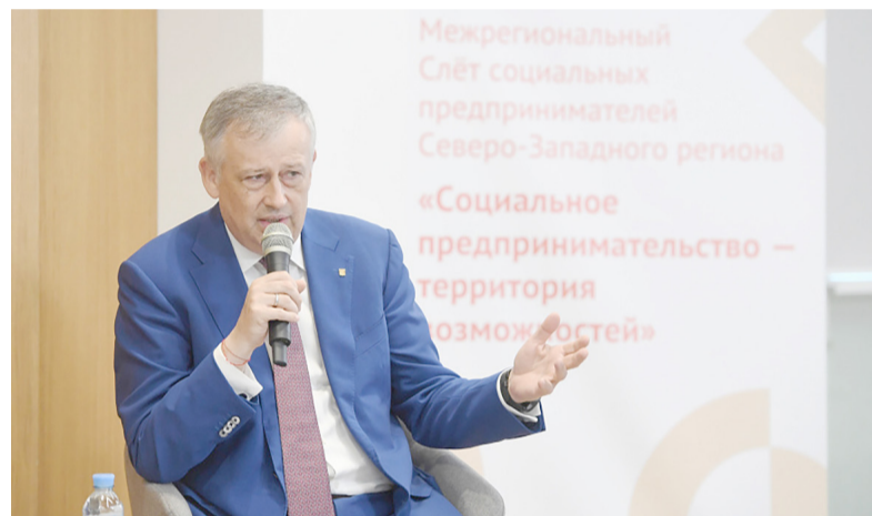
Александр Дрозденко принял участие в работе Слёта социальных предпринимателей

социального бизнеса в реализации нацпроектов» принял участие губернатор Ленинградской области Александр Дрозденко. Наша область является одним из передовых регионов СЗФО по развитию социального бизнеса. У нас